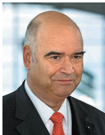
Otto Kentzler, Präsident des Zentralverbandes des Deutschen Handwerks

„Bundesregierung und Wirtschaft wollen gemeinsam dazu anregen, attraktivere Arbeitsplätze für Ältere zu schaffen und mehr altersgerechte Produkte und Dienstleistungen anzubieten. Unsere Handwerksbetriebe sind bestens darauf eingestellt, individuelle Lösungen zu planen und umzusetzen.“